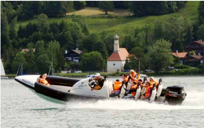
Die „Hoppetosse“ auf dem Tegernsee