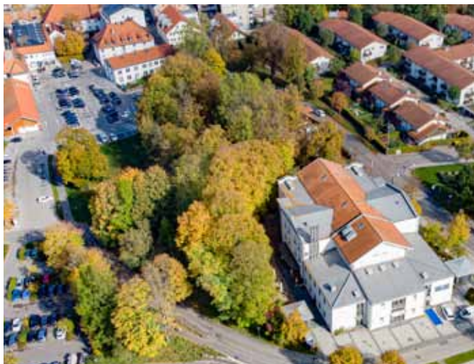
Waitzinger Keller mit Waitzinger Park