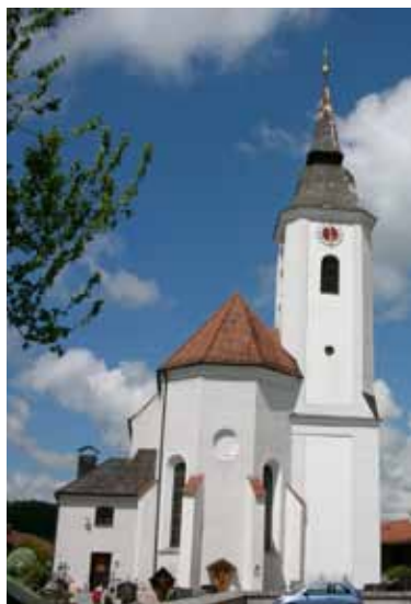
St. Laurentius im Ortsteil Parsberg

Pfarramt, Tel. 08025 6580 www.pfarrverband-miesbach.de E-Mail: pv-miesbach@ebmuc.de